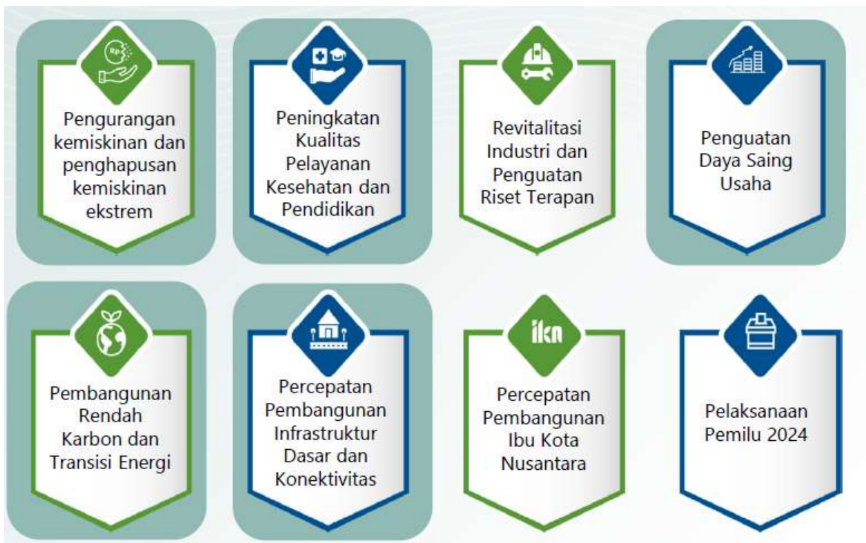
Gambar 3.1 Arah Kebijakan RKP Tahun 2024

Pada Tahun 2024, Tema Pembangunan Nasional yang ditetapkan dalam RKP Tahun 2024 adalah "Mempercepat Transformasi Ekonomi yang Inklusif dan Berkelanjutan" dengan 8 arah kebijakan sebagai berikut: